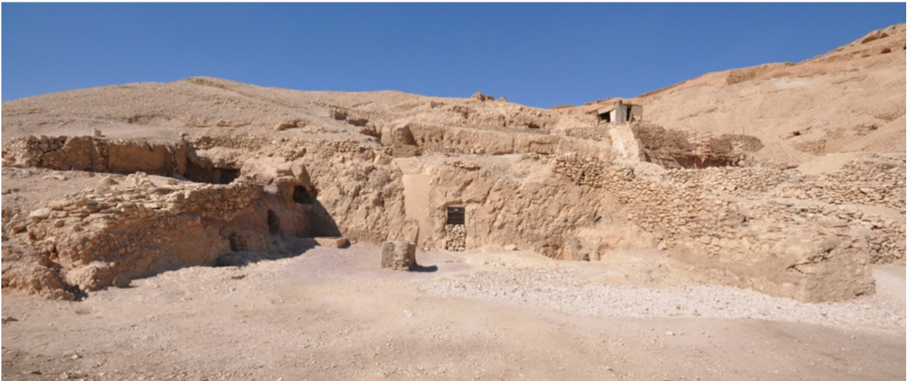
Vue de la cour TT29