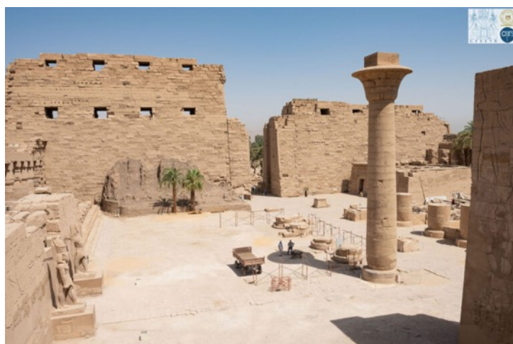
Le kiosque de Taharqa dans la 1 re cour du temple de Karnak

En un siècle à peine, du milieu du 8 e s. au milieu du 7 e s. avant notre ère, l'impact des souverains issus du royaume de Couch en Nubie a laissé une empreinte profonde tout au long de la Vallée du Nil égyptien en modifiant les équilibres politiques jusque dans le Delta, face à la puissance assyrienne. Forts de leur lignage méridional tirant sa légitimité d'un Amon primordial niché dans la Montagne sacrée du Gebel Barkal à la 4 e Cataracte, les pharaons de la 25 e dynastie ont façonné leur pouvoir au cœur même de Thèbes et de son institution religieuse. C'est leur discours programmatique et leur idéologie royale qui ont particulièrement donné une impulsion mémorable à l'essor du temple d'Amon. À la tête d'un Double Royaume uni par un vecteur commun, le Nil, ces souverains n'ont en outre pas manqué de s'appuyer sur les élites égyptiennes pour conforter leur domination.